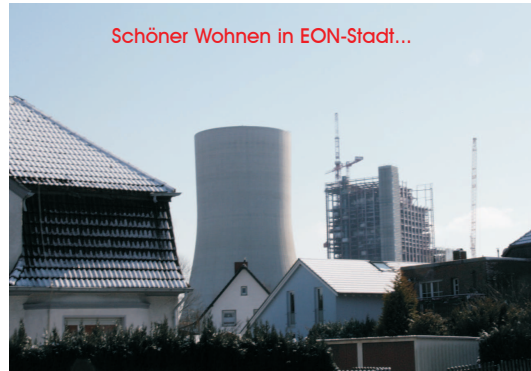
Schöner Wohnen in EON-Stadt...

„In Datteln hat sich Eon das Wohlwollen der Einwohner bereits mit Millionen erkaufte. Laut Aussage Wiedemeiers habe der Konzern erst einen Dattelner Landwirt „sehr reich“ gemacht, ihm das nötige Baugrundstück abgekauft und anschließend „die Nachbarn dort tot geworfen mit Geld“, so Wiedemeier auf Anfrage.